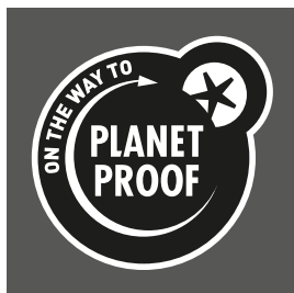
Zwart op een donkere achtergrond