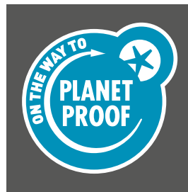
Petrol blauw op een donkere achtergrond