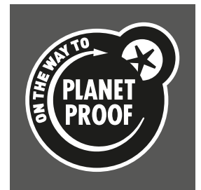
Zwart op een donkere achtergrond

Het logo voor grove druktechnieken mag nooit voor andere doeleinden (zoals plaatsing op websites) gebruikt worden dan drukwerk.