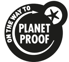
Zwart op een lichte achtergrond