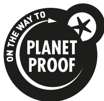
Zwart op een lichte achtergrond