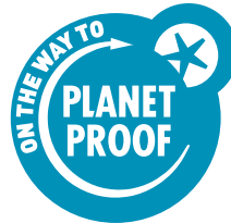
Petrol blauw op een lichte achtergrond

In het aangepaste logo voor grove druktechnieken wordt geen registratienummer geplaatst.