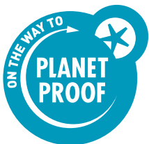
Petrol blauw op een lichte achtergrond

Het logo wordt -zeker wanneer kleiner dan 20 mm breed- bij voorkeur als petrol blauwe variant op een witte ondergrond met witte omgeving gebruikt.