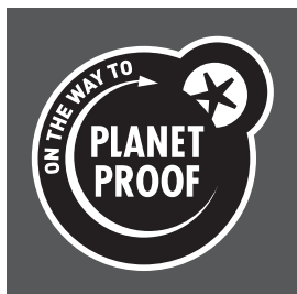
Zwart op een donkere achtergrond

1: Met wit wordt de ondergrondkleur bedoeld, geen witte drukkleur. Wanneer het logo op bijvoorbeeld bruin karton wordt gedrukt zullen de rand en de andere witte elementen in het logo de kleur van de ondergrond aannemen. De kleurweergave van het petrol blauwe logo mag niet sterk afwijken, bij een te donkere ondergrond wordt deze variant dus afgeraden. Kies dan voor het zwarte logo.