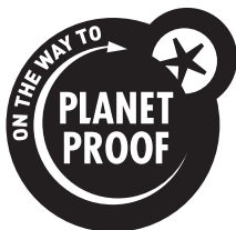
Zwart op een lichte achtergrond