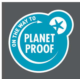
Petrol blauw op een donkere achtergrond